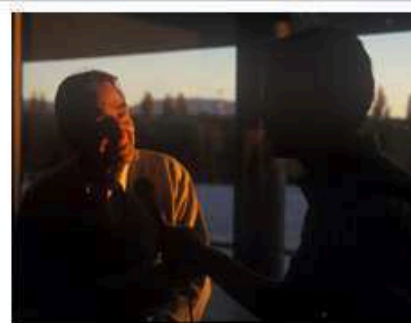
La entrega por sus alumnos hacia que