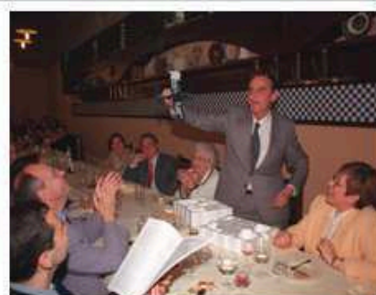
2001. En su homenaje, entre alumnos