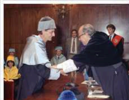
1992. Durante el acto de investidura

El viernes 29, a las 13h. , en el oratorio de la Facultad de Comunicación, se ofrecerá una misa funeral por su alma.