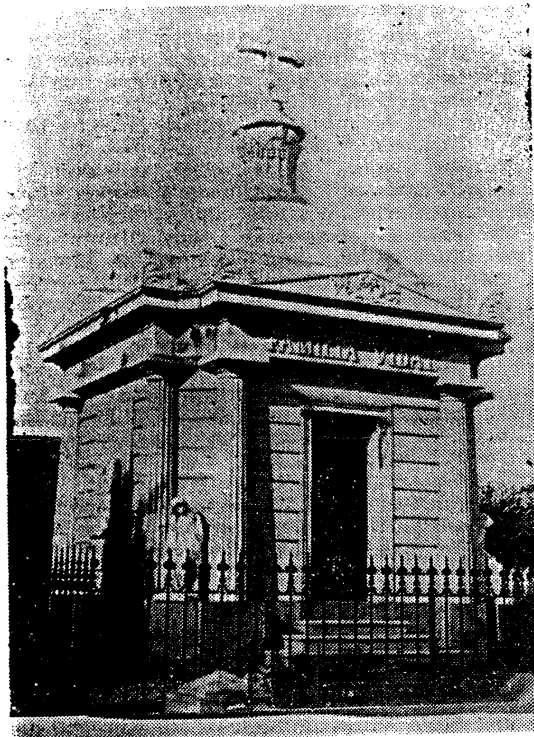
Fotografia del panteó Vidal i Quadras en la qual encara es veu la tercera de les làpides, la que representa la tornada.